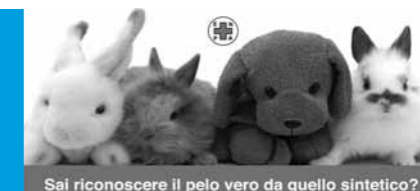
Sai riconoscere il pelo vero da quello sintetico?

Nel 2008 l'attività di informazione e raccolta fondi ha riscosso eccezionale successo. Oltre alle manifestazioni ormai diventate tradizionali, non sono mancati nuovi appuntamenti, come il banco sull'abbandono e il randagismo, quello per la sensibilizzazione sulla sterilizzazione, o quello contro le pellicce, con la realizzazione di numerosi cartelli e volantini originali e accattivanti. Altre manifestazioni inedite, che ci hanno visti partecipi con i quattrozampe del canile, sono state "Un Giorno da Cane" a Pessano con Bornago, e "Scodinzolando in Passarella", dove l'ENPA monzese è stato ospite speciale del Comune di Carnate.